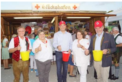
Volksfest Parsberg 2017

Ein herzliches Dankeschön an alle, die uns jedes Jahr mit der Abnahme einiger Lose die Treue halten.