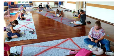
Gruppenstunde der WW-Jugend Neumarkt unter Einhaltung der Abstandsregeln in 2020

Neben der praktischen Übung der Schwimm- und Rettungsfähigkeiten ist die Wasserwacht natürlich auch den Aufgaben des Roten Kreuz verpflichtet und bildet die Mitglieder in regelmäßigen Dienstabenden und Gruppenstunden in der Ersten Hilfe und dem Sanitätsdienst aus.