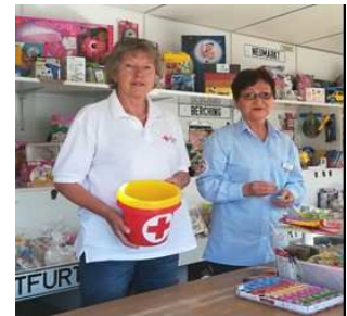
Stadttorfest Freystadt 2019

Wenn auch Sie Zeit und Lust haben, bei künftigen Glückshafenauspielungen zu helfen, dann melden Sie sich doch bei uns! Wir freuen uns über jede Unterstützung! Mit Ihrem Engagement leisten Sie so einen persönlichen Beitrag für mehr Menschlichkeit.