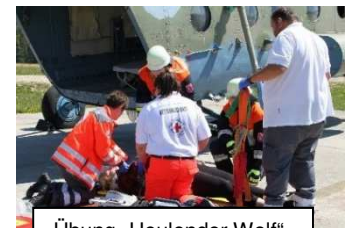
Übung „Heulender Wolf“