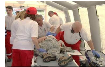
SEG Behandlung im Einsatz