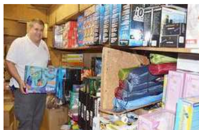
Volksfest Neumarkt 2018