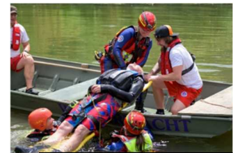
Wasserrettungsüber der WW Dietfurt im Juli 2020

Alle Helfer in der Wasserwacht werden von Klein auf an ihre Aufgaben in der Wasserwacht herangeführt, das beginnt mit dem Erwerb des ersten Schwimmabzeichens, dem „Seepferdchen“ und wird durch regelmäßiges Training und der Abnahme von verschiedenen Prüfungen (z.B. Deutsches Jugendschwimmabzeichen, Deutsches Rettungsschwimmabzeichen etc.) fortgesetzt bis unsere Mitglieder soweit sind mit dem sogenannten Wasserretter ihre Helfergrundausbildung abzuschließen.