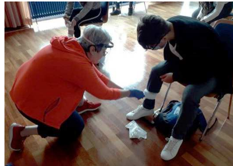
Praktische Übungen in 2020 unter Einhaltung der Hygienevorgaben - Druckverband am eigenen Bein