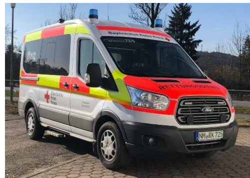
Generationswechsel der Fahrzeuge im Krankentransport