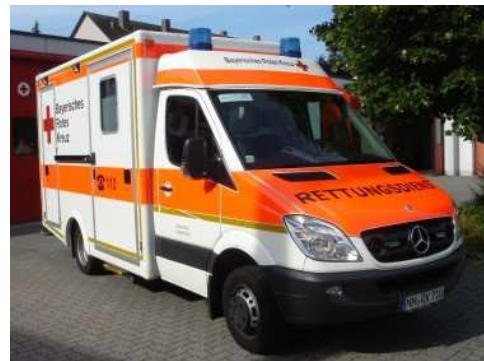
Generationswechsel der Fahrzeuge im Rettungsdienst